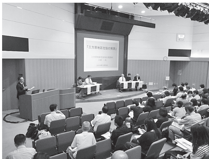
シンポジウムの様子

「地域共生社会の構築について現場での話、学術的な話の両方を聞くことができとても勉強になった」、「様々な立場の連携した取り組みの必要性をあらためて感じた」など、多くのことを学び取っていただけたようでした。その他にも、「自分が専門職を目指した原点や今までの人生を振りかえってみようと思った」「これからも地域の人達の健康に興味を持って活動し、今回のような催しに参加していきたい」という感想もいただきました。